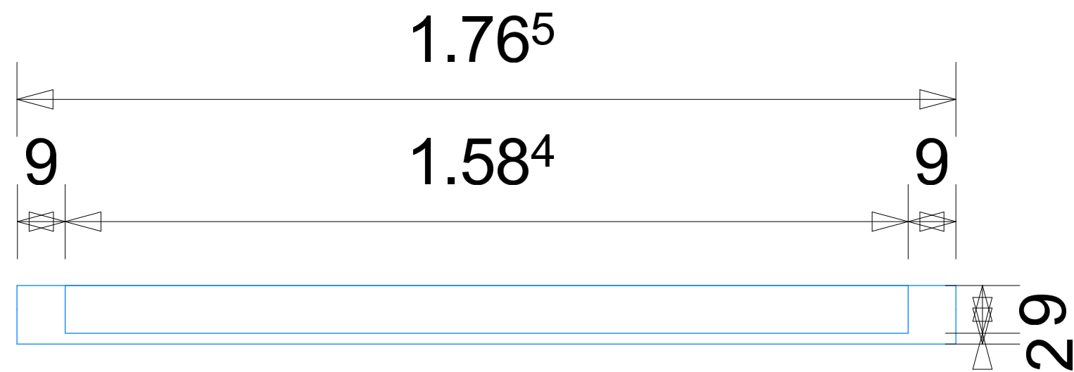
Assemblage des pièces n°4 et 5