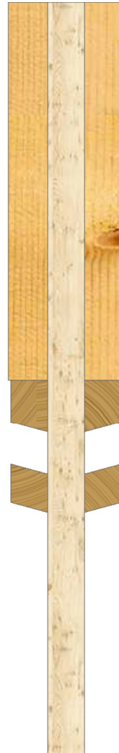
Assemblage arbalétrier/fourrure + poteau composé vue de dessus