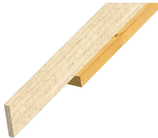
Assemblage arbalétrier/fourrure vue 3D