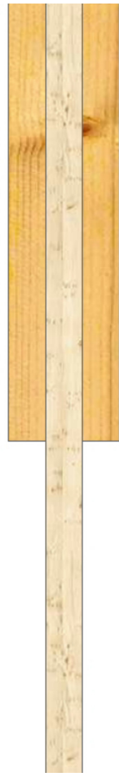
Arbalétrier/fourrure vue de dessus